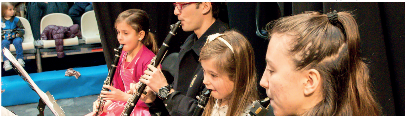
Niños participando con la Banda en el concierto didáctico y participativo BandaManía