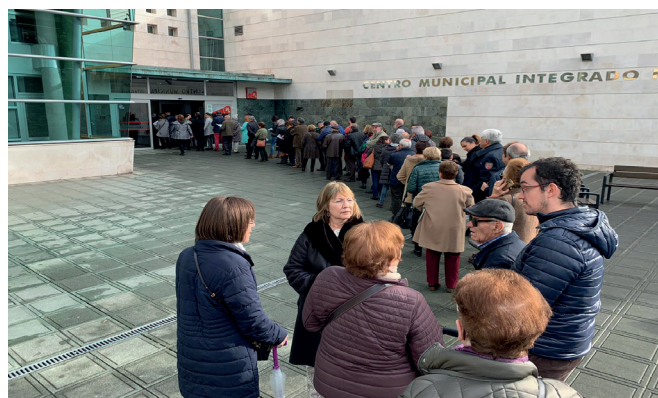
Público haciendo cola en CMI Gijón Sur para oír el concierto de la Banda dedicado a Bernstein

conciertos más enfocados al público actual para que año tras año vaya incrementando de manera exponencial. Este, también cada vez es un público más joven, ya que gracias a conciertos didácticos como BandaManía, hechos y pensados para los niños, atraen a estos así como a adolescentes, descubriendo a esta agrupación como una herramienta para inculcar valores en educación, inspiración o sirviendo de impulso para el comienzo del estudio de la música.