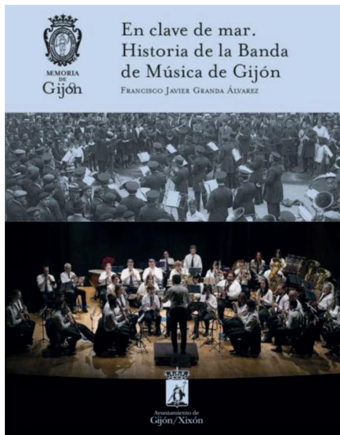
Portada del libro "En Clave de Mar. Historia de la Banda de Música de Gijón"

Han pasado los años, se han sucedido los músicos y los directores, y Gijón dispone de una banda de una calidad excepcional, una banda que luce con orgullo el nombre de la ciudad, que suena y vive para la ciudad, y que en estas páginas nos entrega sus secretos.