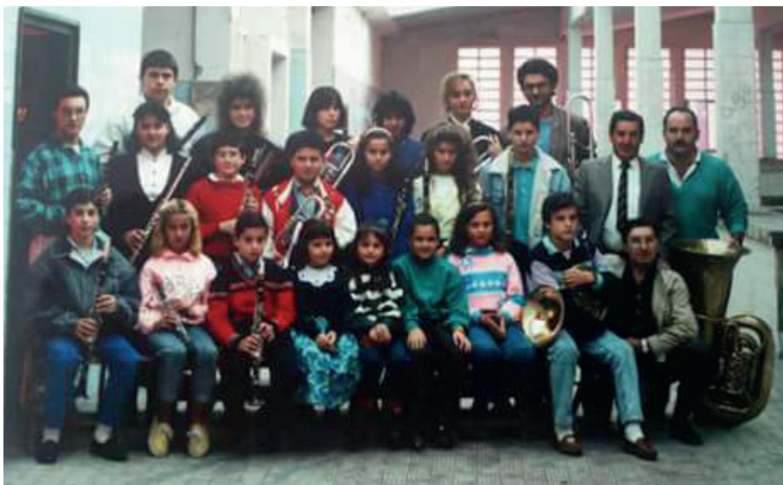
Alumnos de la Escuela de Educandos de la Banda de Música de Gijón - Año 1998

Tras los conciertos didácticos realizados por esta agrupación denominados BandaManía, fueron cientos las solicitudes que nos llegaron por parte del público, pidiéndonos la creación de una escuela. La unión de todos estos aspectos conforma el marco perfecto para abordar proyectos atractivos, innovadores e interesantes, no sólo para la Banda sino también para la vida social y cultural de la ciudad de Gijón. Por todo ello, para asegurar el futuro y la calidad musical de la Banda, se reabre la Escuela después de muchos años, para que se formen músicos de todas las especialidades instrumentales, personas que puedan entrar a formar parte de la agrupación cuando cuenten con un nivel musical adecuado, tras haberse formado y crecido en la asociación, desde el respeto y el amor por la música, al compromiso y la pasión por la Banda.